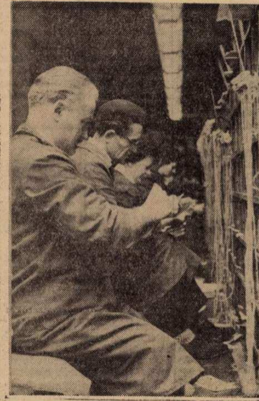
A 62. sz. postahivatal irányítási osztályának törzsgárdája megfeszített munkával dolgozza fel a beérkező anyagot