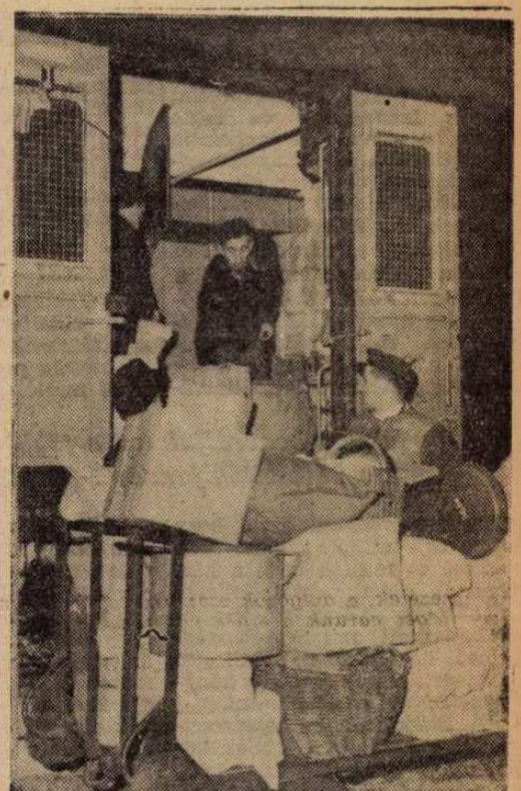
A kedvezőtlen időjárás által okozott menetrendi eltérések a közvetítő osztály dolgozói komoly feladatok elé állították. Szorgos kezek rakják a záhonyi mozgóposta kocsiit