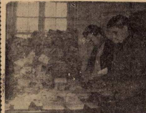
A miskolci postaforgalmi dolgozók az ünnepi csúcsforgalmi időszakban több mint egy millió darab levelet dolgoztak fel