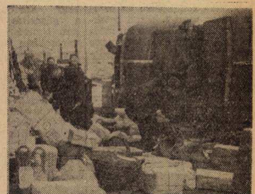
Miskolc 2. sz. postahivatalban az év végi csúcsforgalomban 34 ezren felül volt az átmenő csomagok száma