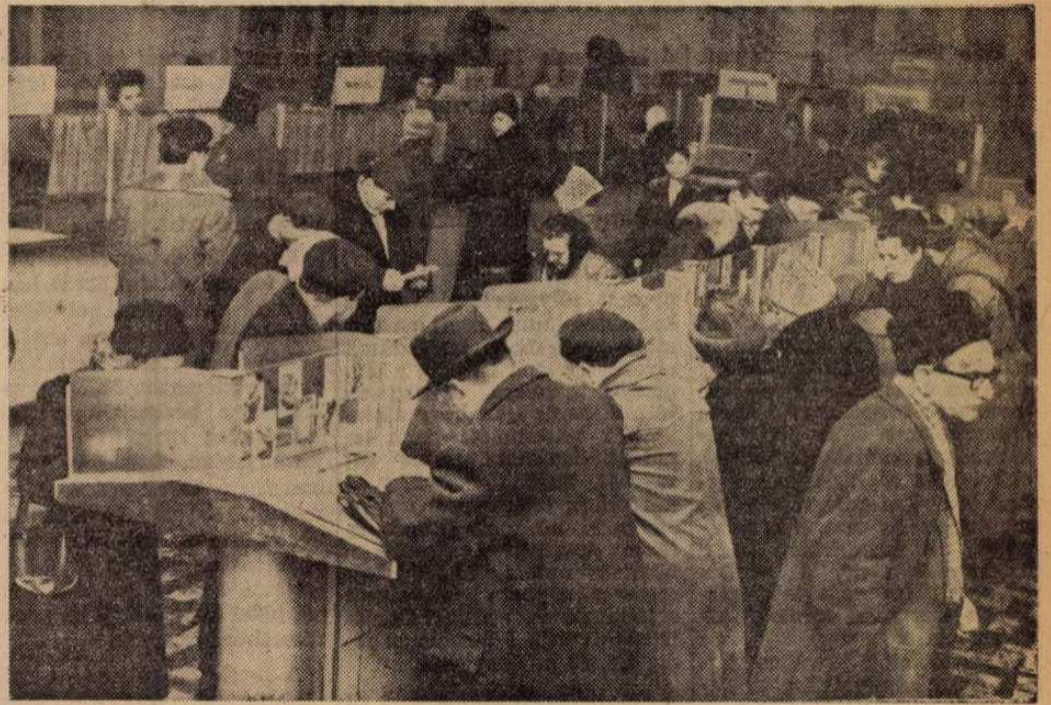
A Budapest 72. sz. postahivatal felvételi termében minden frópuft foglalt. A rendkívüli forgalomra jellemző, hogy a felvételi osztály az év bevételei irányzásait már az ünnepek előtt teljesítette.