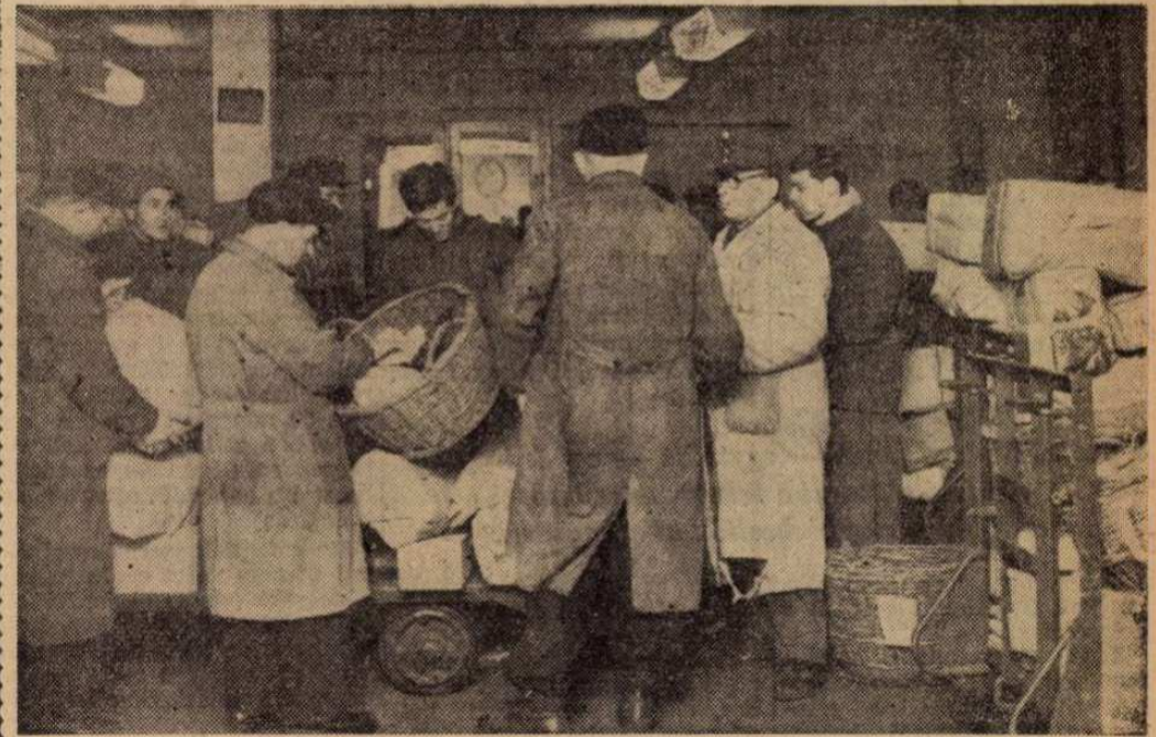
A továbbító osztály dolgozói csomagirányítás közben